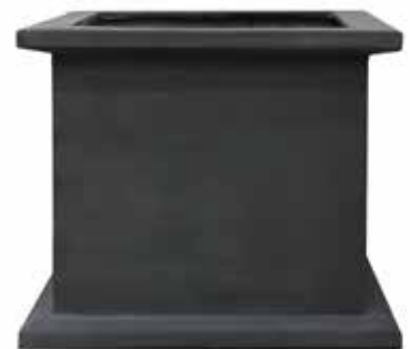
KEN03 900 x 900 x 800mm KEN04 1100 x 1100 x 1000mm kensington watertank