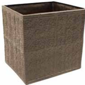
CARDIN03 800 x 800 x 800mm cardinal watertank