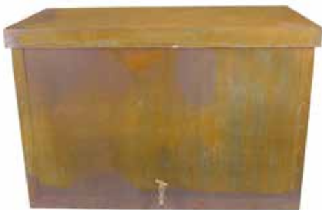
BRU9 1200 x 600 x 800mm brunel watertank shown in rust with optional tap and lid