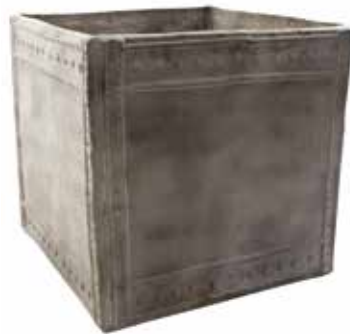
ROSE04 800 x 800 x 800mm rose watertank