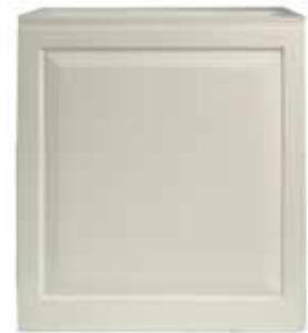
CHEL7 800 x 800 x 800mm CHEL8 1000 x 1000 x 1000mm chelsea watertank